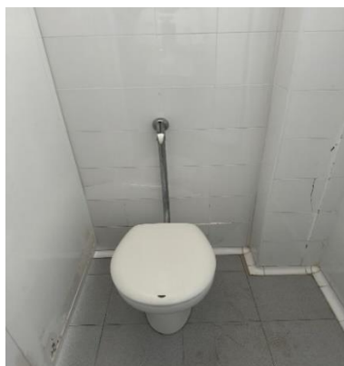
Pulsadores baños primaria