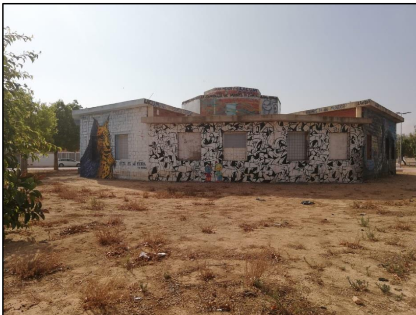
Imagen 14: Centro Cívico La Dorada