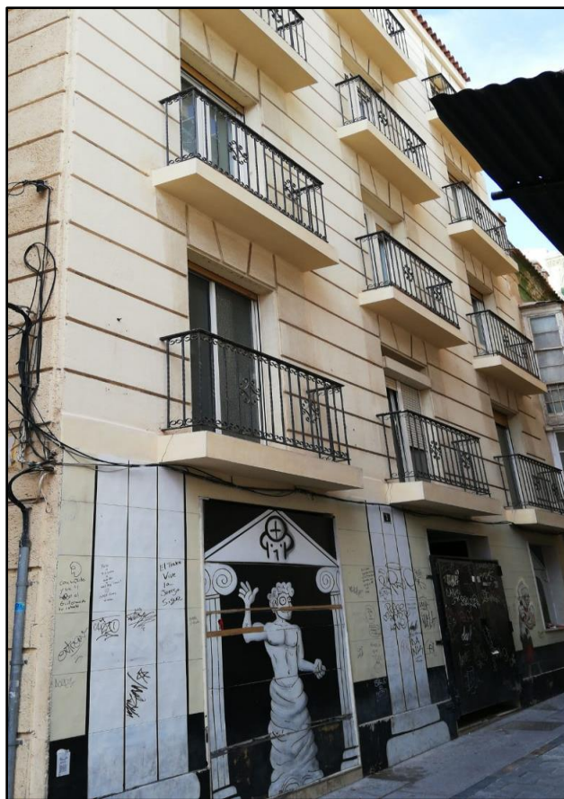
Imagen 3: Hotel Peninsular