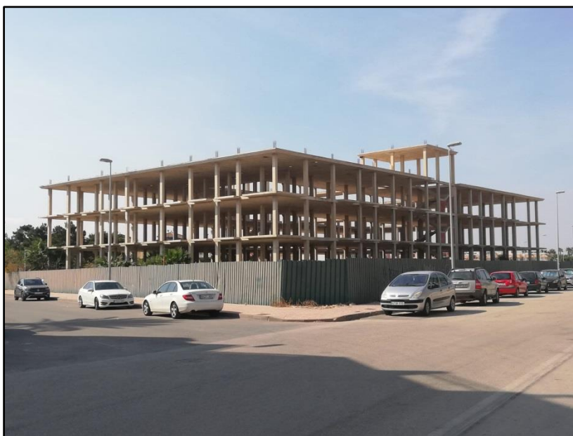
Imagen 15: Residencia tercera edad plan parcial Los Lorenzos