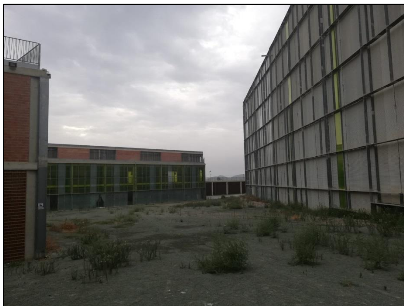
Imagen 7: Teatro Auditorio