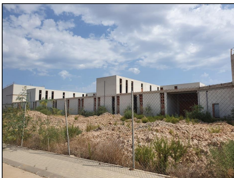
Imagen 4: Centro de Conocimiento Digital y Creatividad Audiovisual