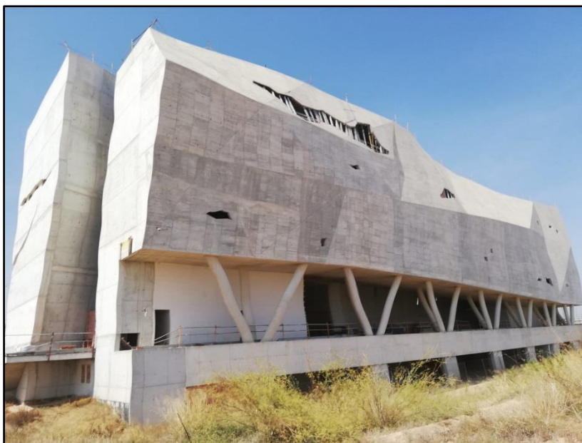
Imagen 22: Museo Regional de Paleontología y de la Evolución Humana