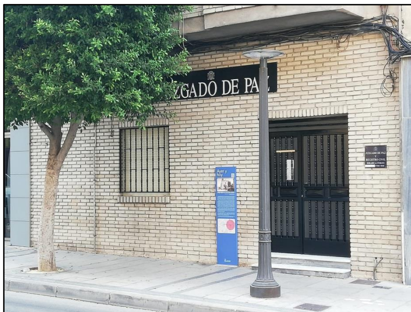
Imagen 9: Local arrendado