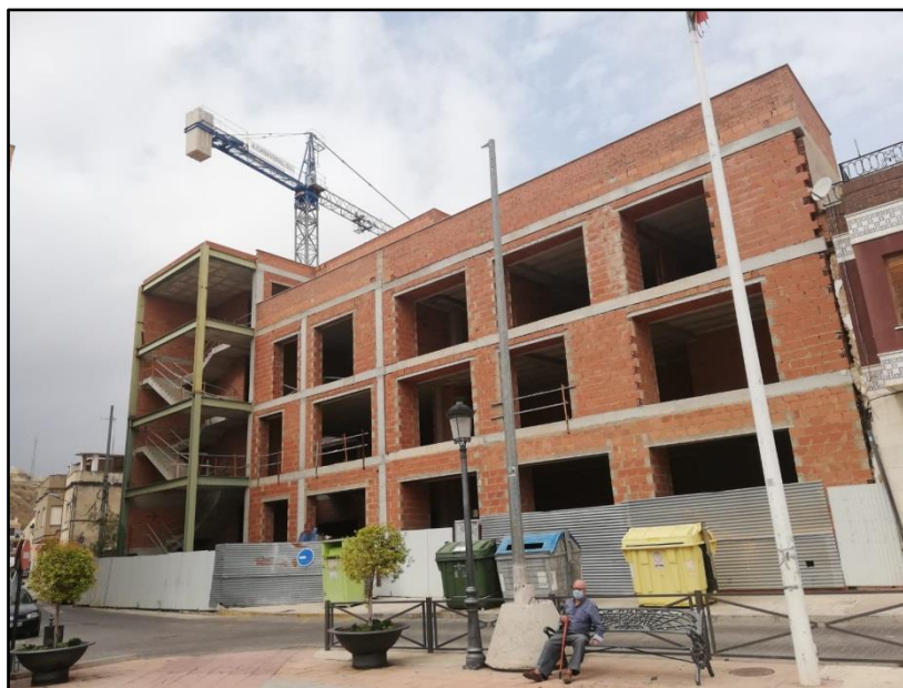
Imagen 17: Ampliación de la Casa Consistorial