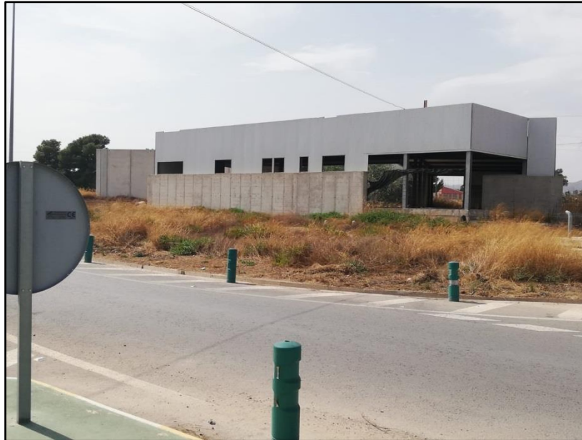
Imagen 19: Centro de atención policial