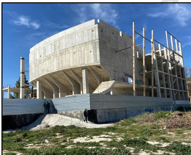
Imagen 10: Exterior del Centro multicultural