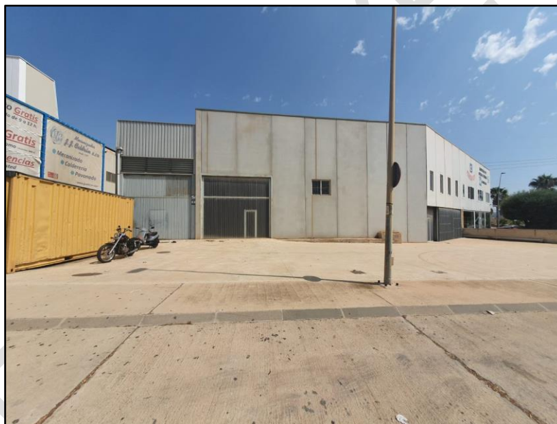
Imagen 8: Nave industrial arrendada