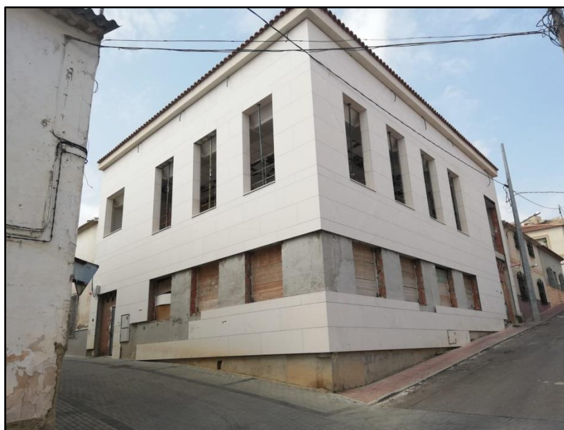
Imagen 21: Centro folklórico Virgen del Rosario