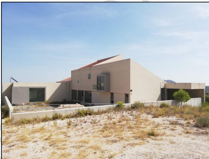
Imagen 5: Centro de visitantes Sierra de Pila