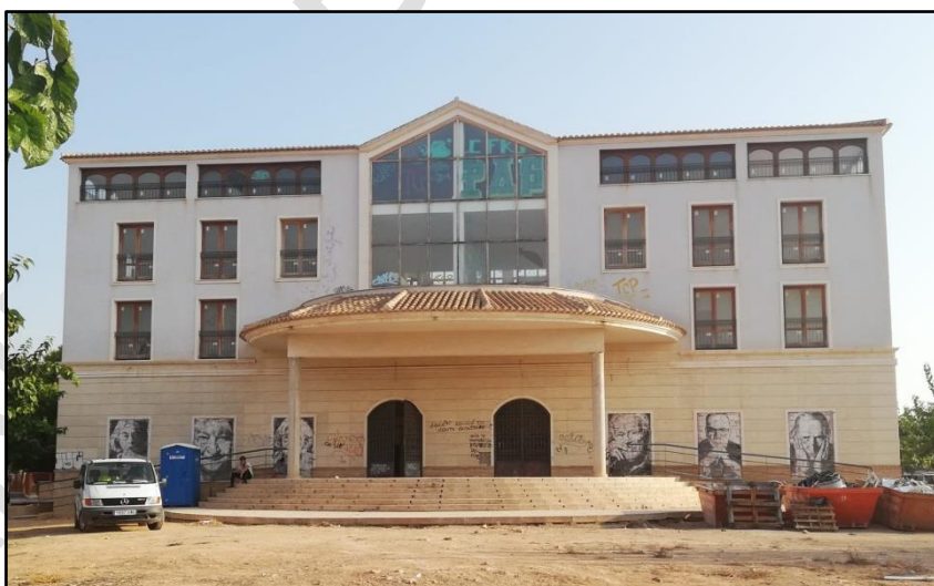
Imagen 16: Casa de la Juventud y Teatro-Centro Cultural Alcazareño