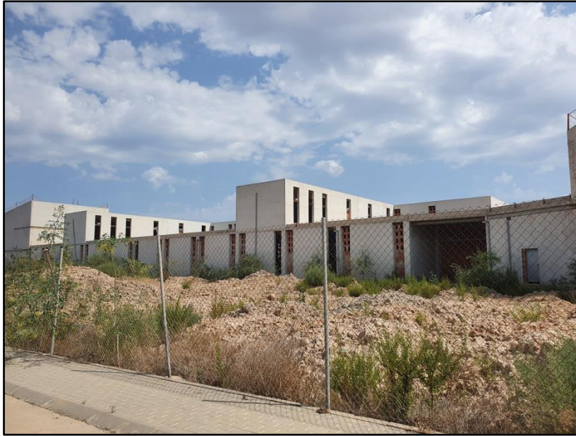
Imagen 4: Centro de Conocimiento Digital y Creatividad Audiovisual