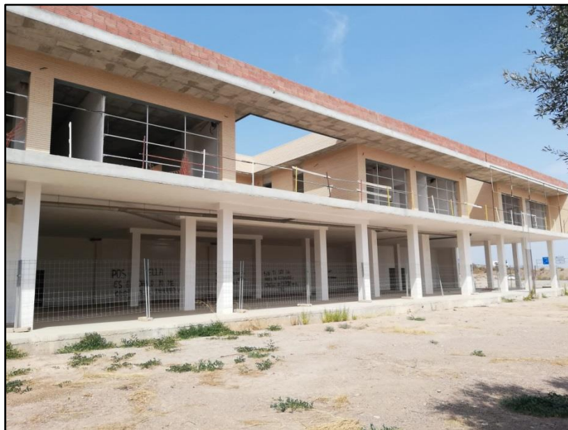
Imagen 18: Base de emergencias