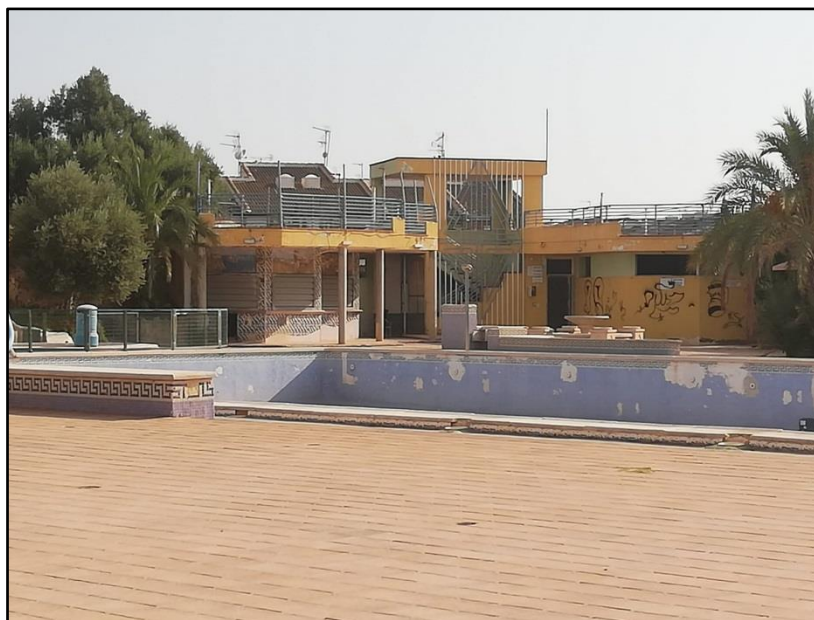
Imagen 6: Piscina Municipal Ola Azul