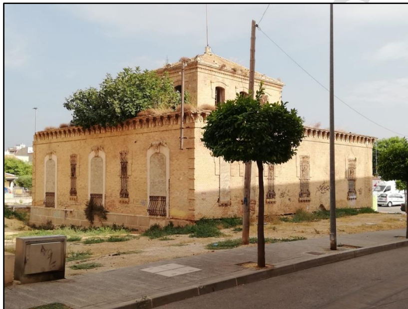
Imagen 2: Chalet Precioso