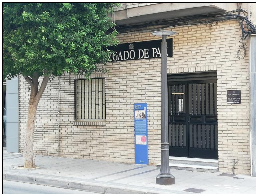
Imagen 9: Local arrendado