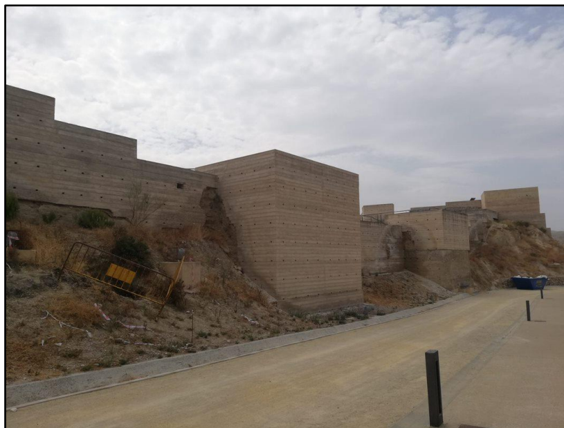
Imagen 20: Castillo de Nogalte