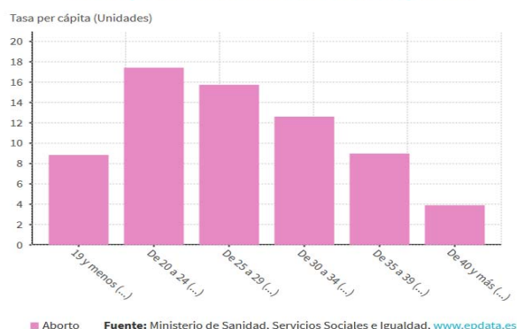
Interrupciones voluntarias del embarazo, por edad

Es de resaltar que cerca del 90 por ciento de esos abortos lo son a petición de la mujer, siendo especialmente preocupante que casi el 40 por ciento de las mujeres que deciden